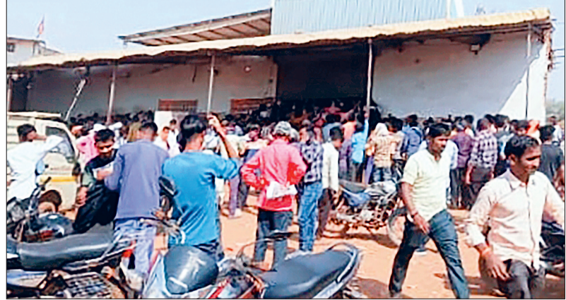
था ! जिनमें 23 मार्च को दो करोड़ 95 लाख, 24 मार्च 4 करोड़ 65 लाख वही 26 मार्च को एक करोड़ 85 लाख रुपए कि शराब मदिरा प्रेमियों ने जिले की दुकानों से खरीद थे ! इस तरह जिले के शराब शौकीनों ने इन 3 दिनों में जहां 9 कोड 45 लाख की शराब को गटक गए थे