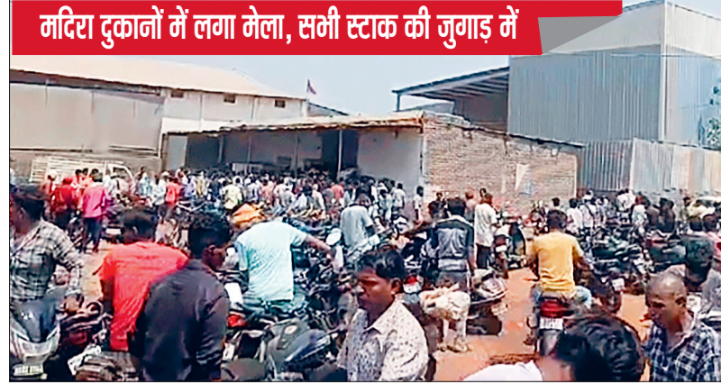
मदिरा दुकानों में लगा मेला, सभी स्टॉक की जुगाड़ में