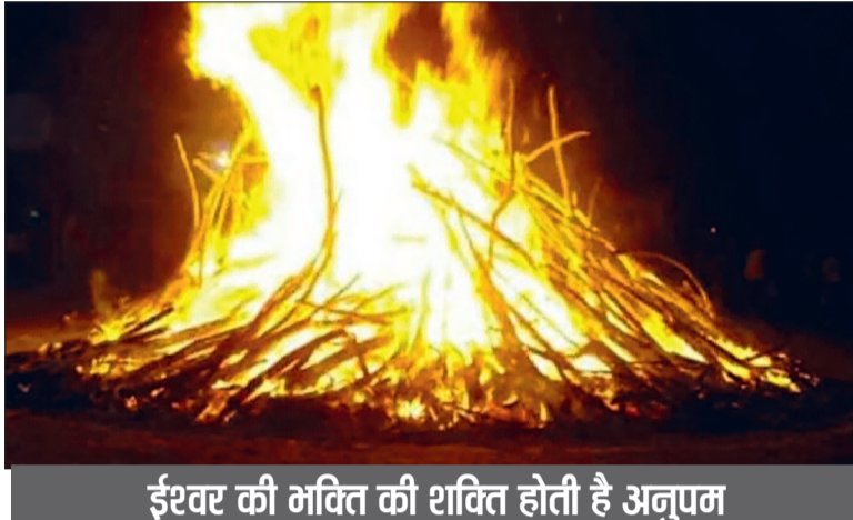
ईश्वर की भक्ति की शक्ति होती है अनुपम

हरिभूमि न्यूज ▶▶ बेमेतरा जिला मुख्यालय सहित विभिन्न ग्रामीण क्षेत्रों में श्रद्धा भक्ति के साथ पूजा अर्चना कर गुरुवार होलिका दहन किया गया। इस मौके पर महिलाओं ने होलिका दहन के पूर्व होलिका स्थल पर पूजा अर्चना की प्रक्रिया सम्पन्न किए। इसके लोगों ने होलिका दहन किए जाने के उपरांत झांझ मंजीरे नगाड़े की थाप साथ फाग गीत गाते हुए एक दूसरे को रंग गुलाल से सराबोर किए। जिले में इस वर्ष गुरुवार को होलिका दहन किया गया इसके लिए लोगों ने सुबह से ही जहाँ रंग गुलाल की खरीदारी की वहीं विभिन्न फकवान भी बनाए इसके अलावा होलिका दहन के लिए शाम से ही खासकर युवा वर्ग के लोग लकड़ी एकत्र करने में जुट गए जो देर रात तक जारी रहा रात में शुभ मुहूर्त पर परंपरा अनुसार बेगा ने विभिन्न मंत्रों एवं विधि विधान के साथ होलिका का पूजन अर्चना किया तदुपरांत शुभ मुहूर्त में लोगों ने होलिका का दहन किया इस अवसर पर लोगों ने झांझ मंजीरा नगाड़े के धुन पर फाग एवं होली गीत गाए और रंग गुलाल भी एक दूसरे को लगाया। इसके पहले महिलाओं ने होलिका का पूजन अर्चना किया इस अवसर पर महिलाएं सुबह से ही होलिका दहन स्थल पर पहुंचकर जल अक्षत कुमुकुम सिंदूर फुल चढाए एवं अगरबत्ती धूप दीप के साथ पूजा अर्चना की एवं आरती उतार कर आशीर्वाद लिया और होलिका का नियमानुसार परिक्रमा भी किए। जिला मुख्यालय में होलिका दहन विभिन्न स्थानों पर किया गया जिसमें प्रमुख रूप से