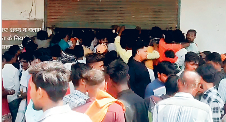
स्थानों में पुलिस को बुलाना पड़ा। उल्लेखनीय हो कि पिछले वर्ष 2024 में मार्च माह में होली पर्व मनाया गया। जिसमें आबकारी विभाग के आंकड़ों के अनुसार 23 और 24 मार्च होलिका दहन और होली व तीसरे दिन 26 मार्च इन 3 दिनों में 9 करोड़ 45 लाख की देसी और विदेशी शराब की बिक्री किया गया