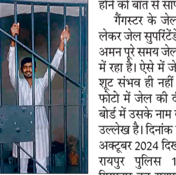
हरिभूमि न्यूज ►► रायपुर