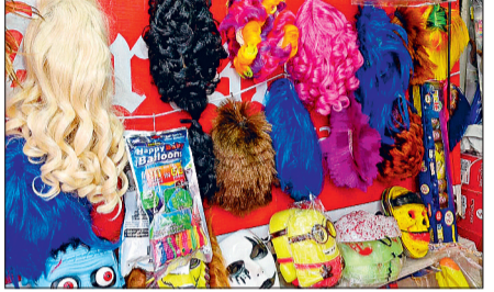
हरिभूमि न्यूज ►► रायपुर

जिला प्रशासन ने होली त्योहार पर डीजे के साथ मुखौटे पर प्रतिबंध लगा रखा है। इसके बाद भी शहर की स्थाई और अस्थायी रंग-गुलाल-पिचकारी की अनेक दुकानों में मुखौटों की खुलेआम बिक्री हो रही है। प्रशासन ने मुखौटे पर प्रतिबंध तो लगा रखा है, लेकिन इसे बेचने वालों पर नकेल कसने और कार्रवाई करने के लिए टीम का गठन नहीं किया है। इस कारण शहर में होली विक्रेता बेधड़क दुकानों में मुखौटे बेच रहे हैं।